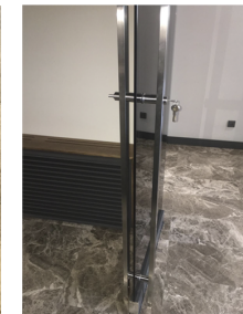
Tirador Inox. con llave.